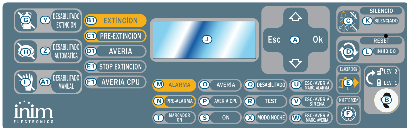
Figura 1 - Panel frontal de la central