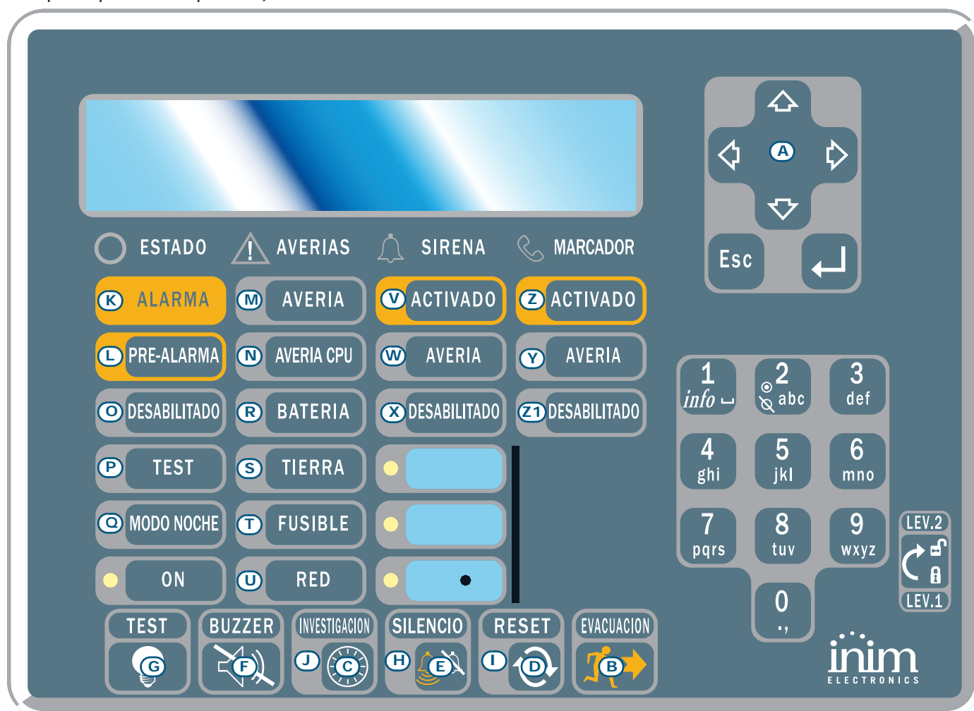
Figura 2 - Vista frontal del repetidor

Pueden conectarse hasta 4 repetidores. Estos replican toda la información de la central y permiten acceder a las funciones de Nivel 1 y 2 (ver y desplazarse por los eventos activos, resetear, silenciar, etc. el acceso al menú principal NO es posible).